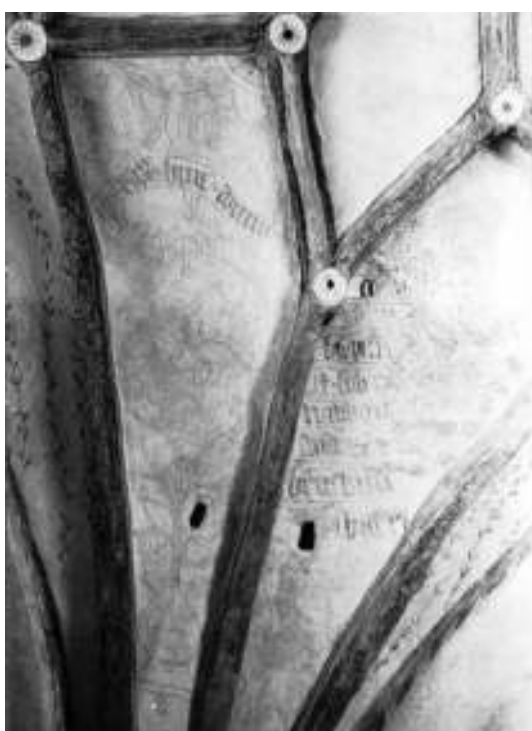
Bild 7 överst t.v: Ett av hålen i skärningspunkten mellan valvriibborna i östra långhusvalvet. Bild 8 ovan t.h: En annan skärningspunkt i samma valv som föregående bild försedd med trätapp med bemälad ände. Bild 9 t.v: Äldre fotografi i ATA tagen i samband med kalkmålningarnas framtagande på 1930-talet. Även på denna bild framträder skärningspunkterna mellan stjärnvalvens valvriibbor med hål, en del av dem försedda med tapper, bland annat skärningspunkten längs till böger på bilden.

Vid rengöring av långhusets bemålade valv iaktogs att i det östligaste valvet hade retuscheringar från framtagandet av målningarna år 1931 även skraffering i putsytan. Liknande skrafferingar förekom inte i långhusvalv nummer två från öster eller korvalvet. Skraffering av nytillkomna/retuscherade ytor var en modell som bland annat riksantikvarie Sigurd Curman rekommenderade vid restaureringar av kulturhistoriskt intressanta byggnader under 1900-talets första decennier. Anledningen till att skrafferingar endast förekommer i ett valv kan vara att det är olika konservatorer som utfört arbetena i de olika valven. Fredrika Mellander Rönn och Hélenè Svahn har i sitt examensarbete Konservator Alfred Nilsons kyrkorestaureringar 1925-47 studerat ett tiotal kyrkor där Alfred Nilson och hans verkstad varit verksamma. Resultatet av deras studie överensstämmer mycket väl med de äldre konserveringstekniska iakttagelserna i Mörrarps kyrka.