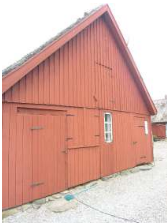
Ställängans östra gavel.