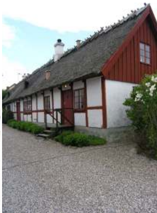
Mangårdsbyggnadens västra långsida samt södra gavel.