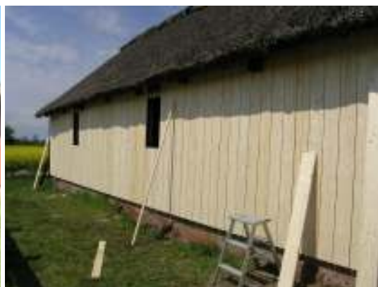
Stallängans fasad med nyuppsatta kläselbräder.

Mot bakgrund av masonitens skadebild beslutades det att den skulle ersättas med kläselbräder och läkt. Åtgärderna omfattar större delen av stallängans södra vägg. Den del som undantas är dold bakom befintlig överbyggnad för vedupplag.