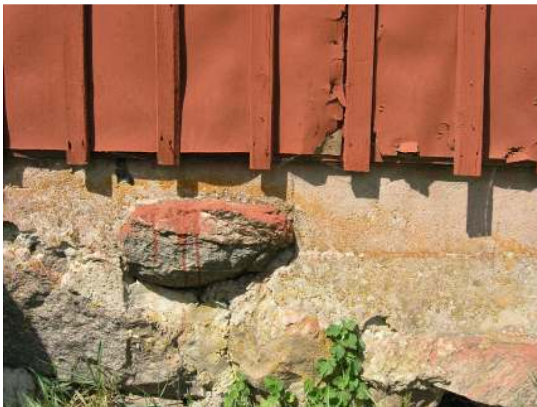
Ställängans masonitbeklädda södervägg med sprickbildning, hål och lös läkt. Rödfärgsstänke på gråstenssockeln har tillkommit före aktuella åtgärder.