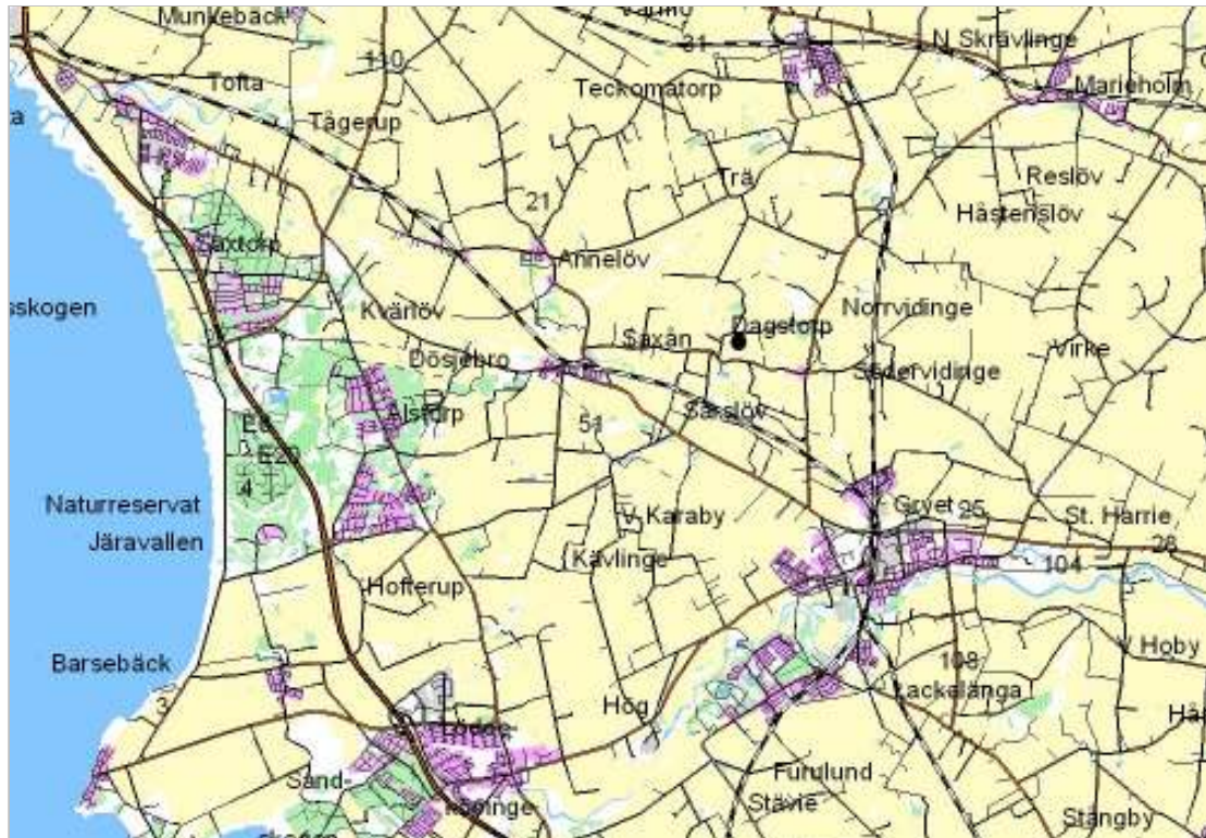
Gamlegård Dagstorp 5:2 ligger omkring 5 km nordväst om Kävlinge.