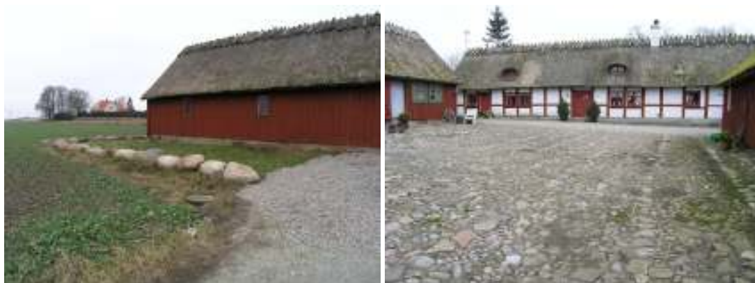
Ställängans södra fasad före renovering.