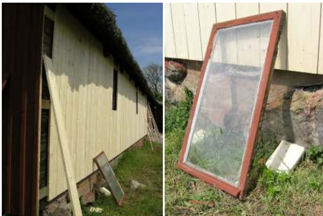
Kläselbrädernas förankring i befintlig väggkonstruktion. Stallfönster som tillfälligt fick lyftas ut.