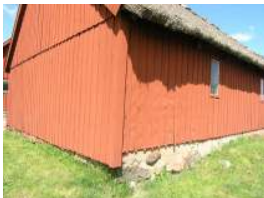
Stallängans södra fasad före renovering.