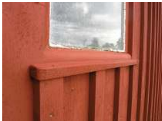
Ställängans västra gavel och södra vägg efter åtgärder.