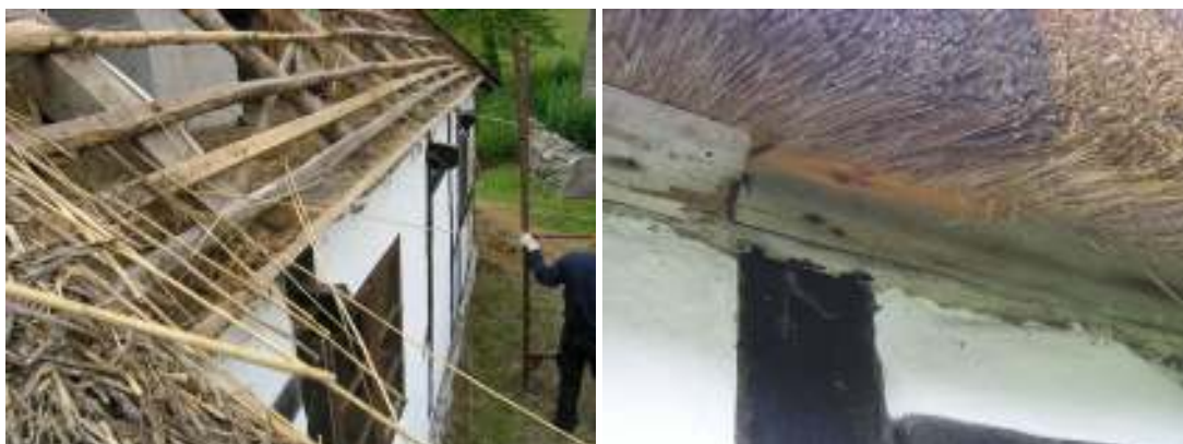
Omläggning av taksti ovanför boningslängan.