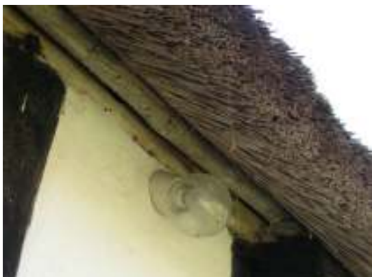
Detalj av vasstak ovanför stallängan.