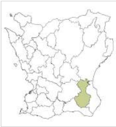
Glimmeboda ligger i Tomelilla kommun.