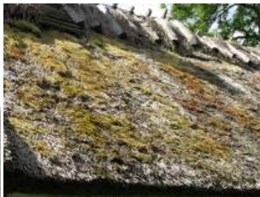
Taksti ovanför boningsdel, även det med vasstak.