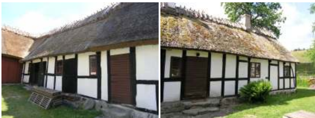
Sti över stallänga till vänster liksom sti över boningsdel till höger, före omläggning av respektive taksti.