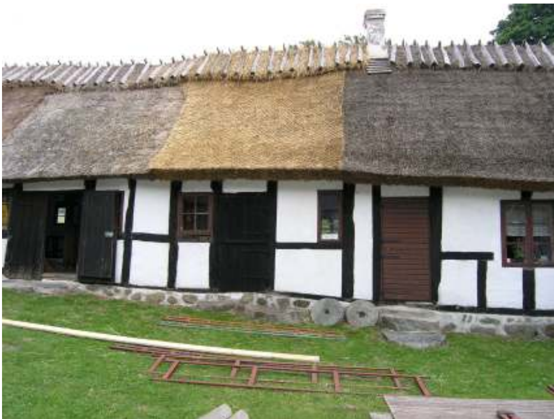
Stallängans taksti efter att arbetena nyligen hade avslutats.