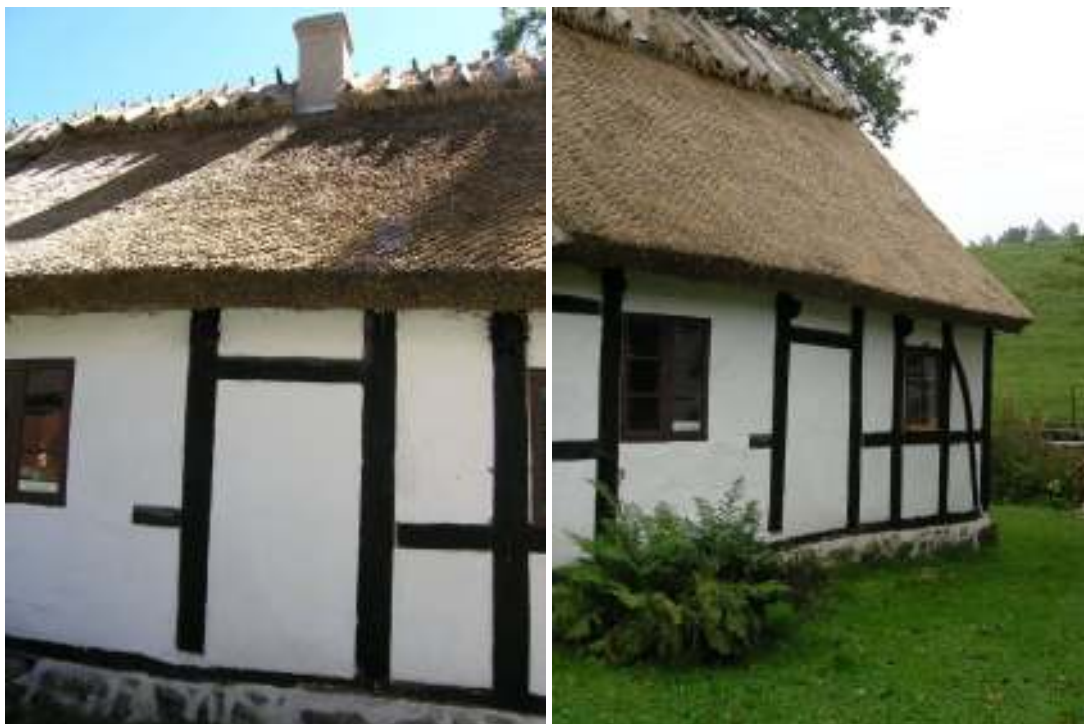
Omlagt taksti på boningsdelens norra takfall.

Halmen som har använts till årets taktäckning kommer delvis från hembygdsförningens egen odling men till övervägande del från Danmark. Hassel till rafterna har i så stor utsträckning som möjligt hämtats lokalt.