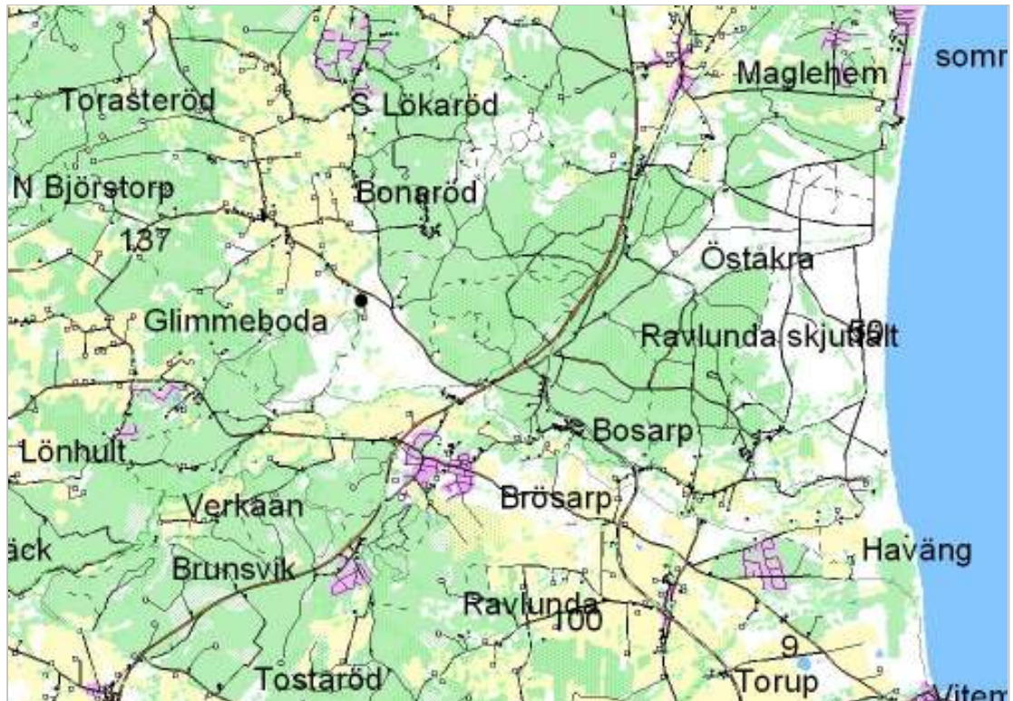
Glimmebodagården markerad med punkt.